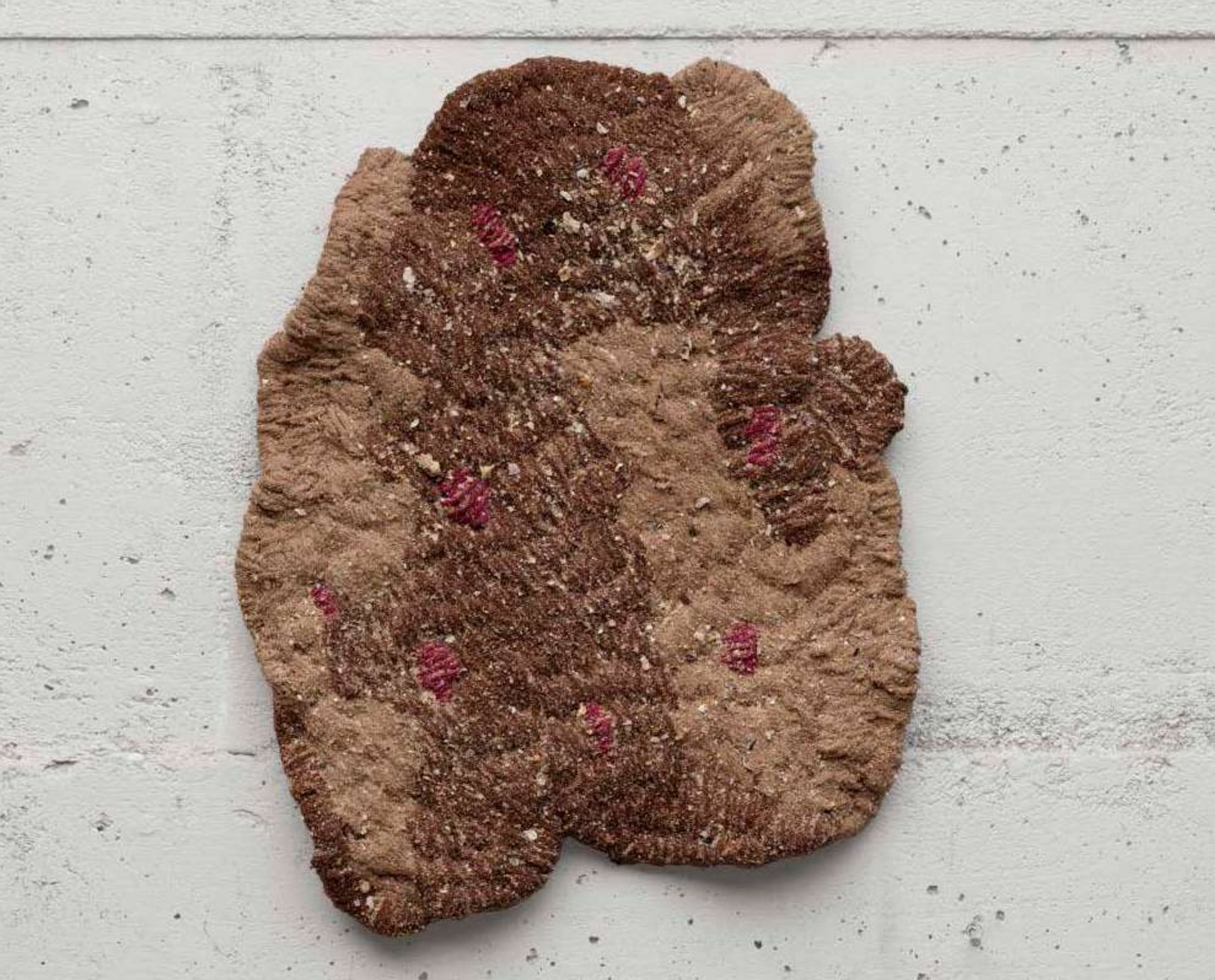
Urso [Bear], 2025 Areia de praia, fragmentos de conchas e pva sobre bordado de lã [Beach sand, shell fragments, and PVA on wool embroidery] 38 x 30 cm [15 x 11 3/4 in] (YL-0019)