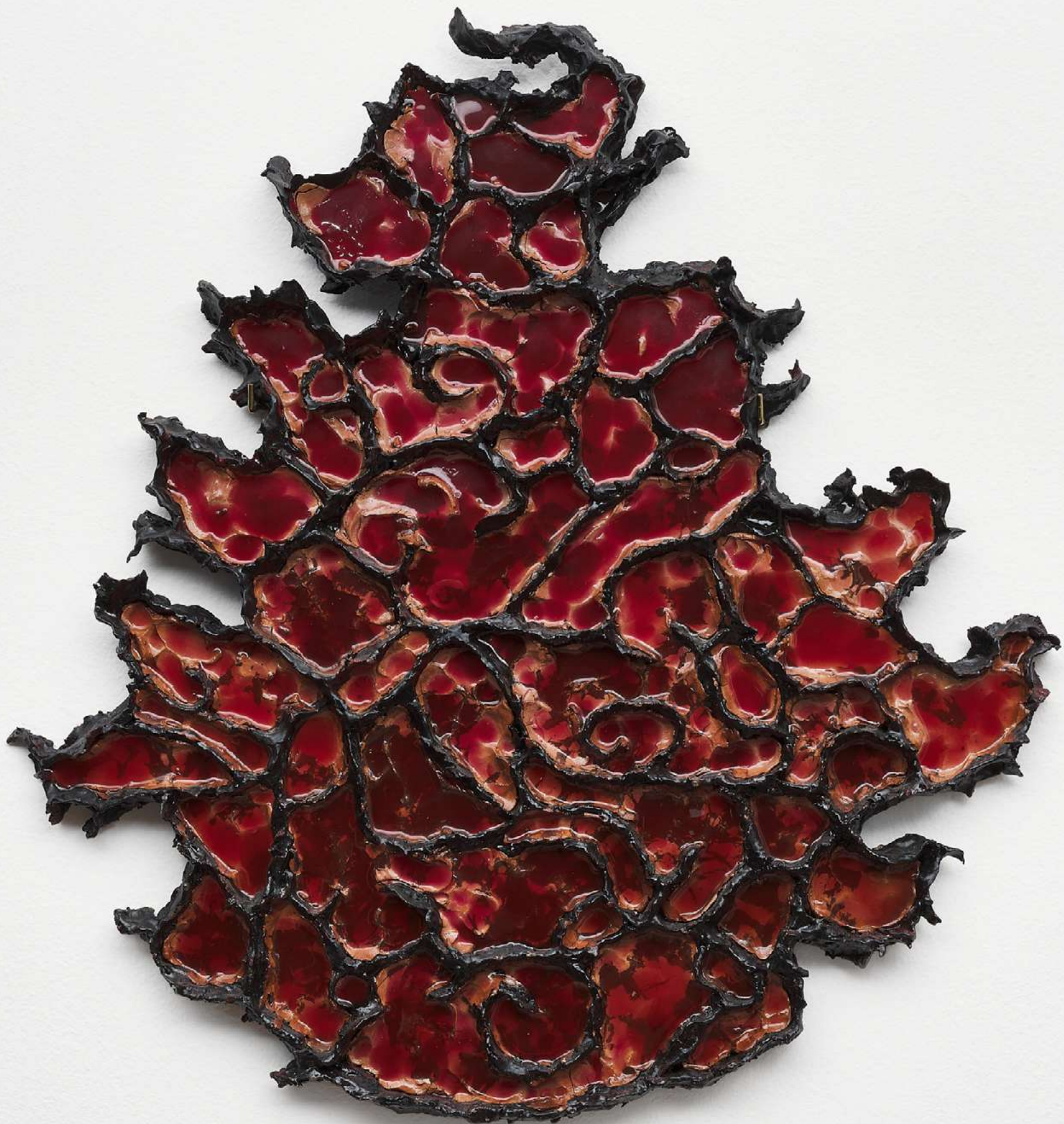
Vitrália fogo [Fire Stained Glass], 2023 Argila, resina e porcelana fria [Clay, resin, and cold porcelain] 61 x 58 x 4 cm [24 x 22 7/8 x 1 5/8 in] (YL-0001)