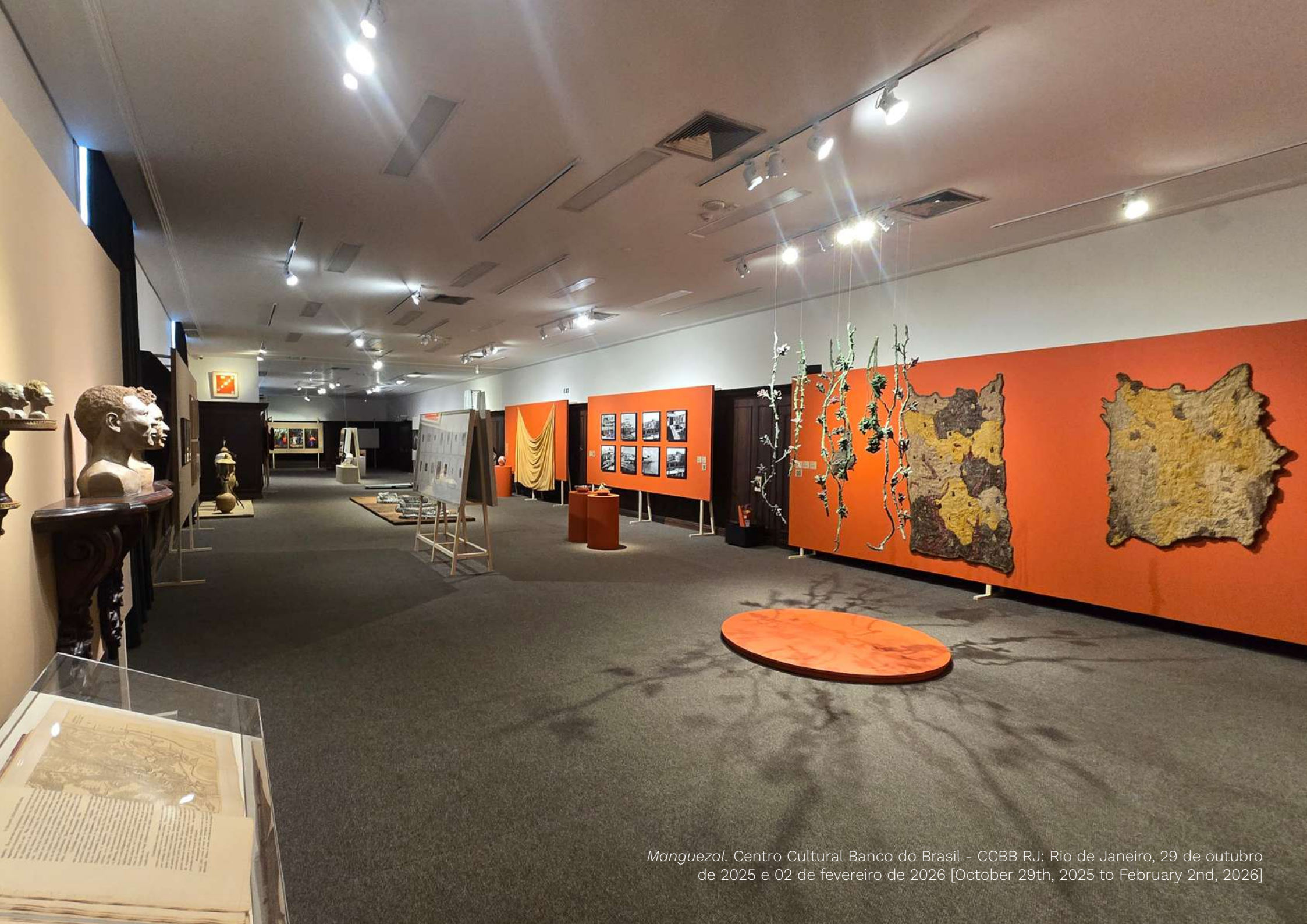
Manguezal . Centro Cultural Banco do Brasil - CCBB RJ: Rio de Janeiro, 29 de outubro de 2025 e 02 de fevereiro de 2026 [October 29th, 2025 to February 2nd, 2026]