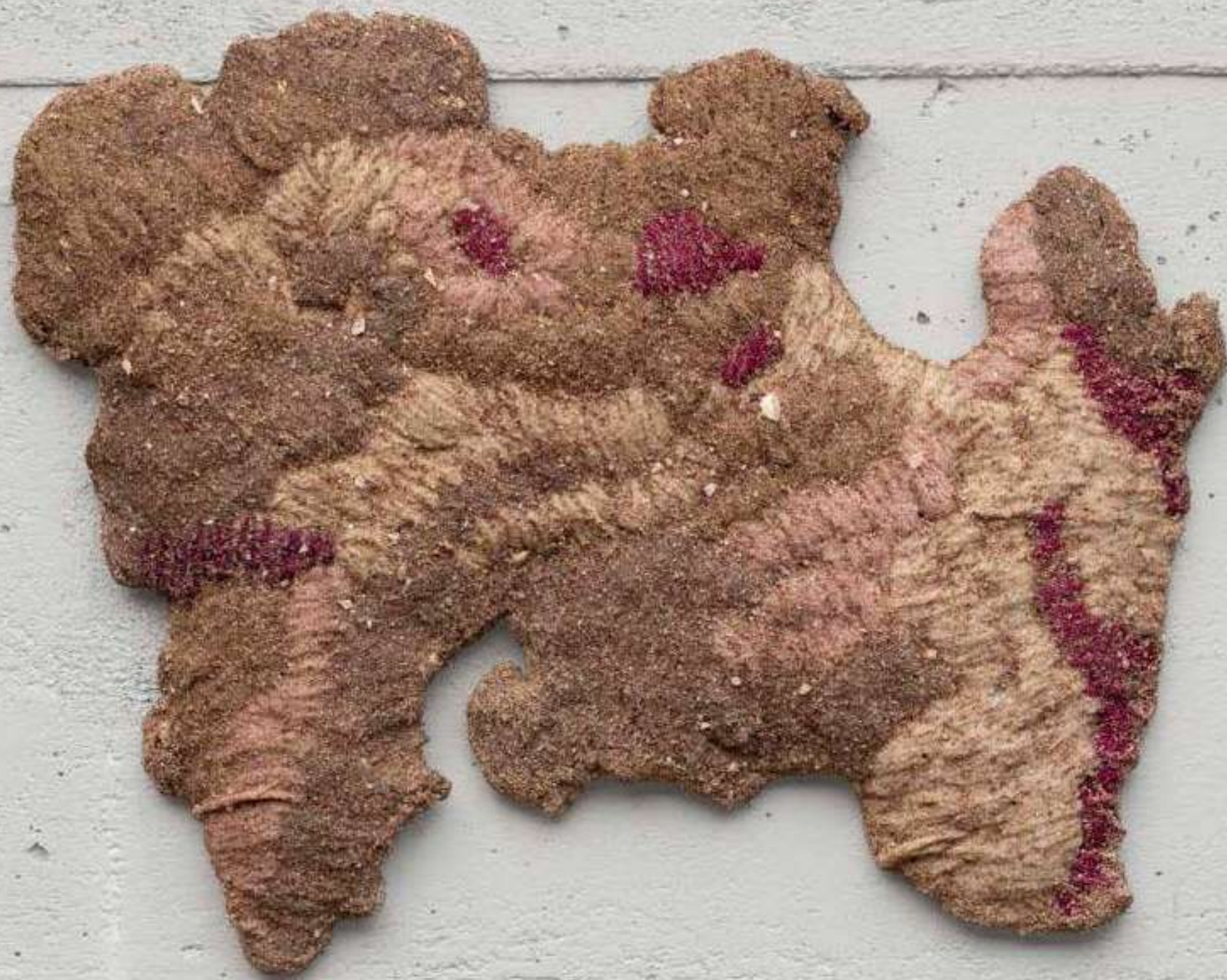
Salar [Salt Flat], 2026 Areia rosa, fragmentos de conchas e pva sobre bordado de lã [Pink sand, shell fragments, and PVA on wool embroidery] 39 x 31 cm [15 3/8 x 12 1/4 in] (YL-0010)