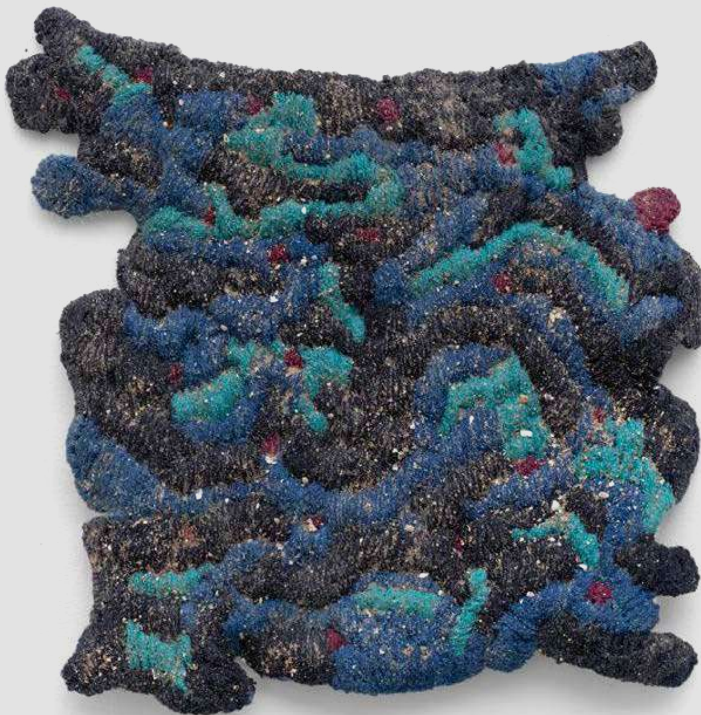
Mergulho [Dive], 2026 Areia, pirita e fragmentos de conchas sobre bordado de lã [Sand, pyrite, and shell fragments on wool embroidery] 48 x 51 x 3 cm [18 7/8 x 20 1/8 x 1 1/8 in] (YL-0069)