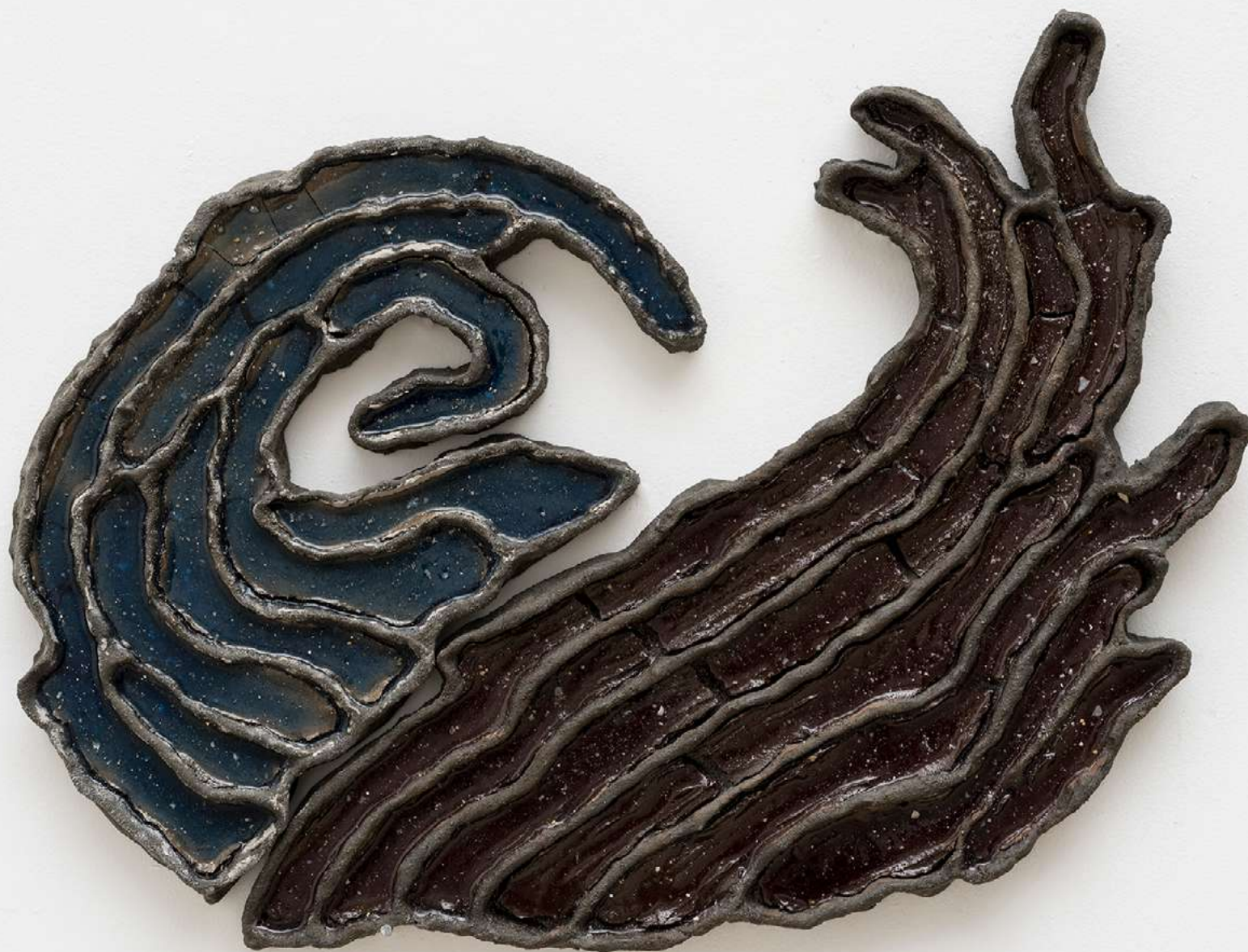
Ondário [Waveform], 2026 Assinada no verso [Signed on the reverse] Areia, fragmentos de conchas, cimento, pó de mármore, resina, argila e porcelana fria [Sand, shell fragments, cement, marble powder, resin, clay and cold porcelain] 42.5 x 60.5 cm [16 3/4 x 23 7/8 in] (YL-0021)