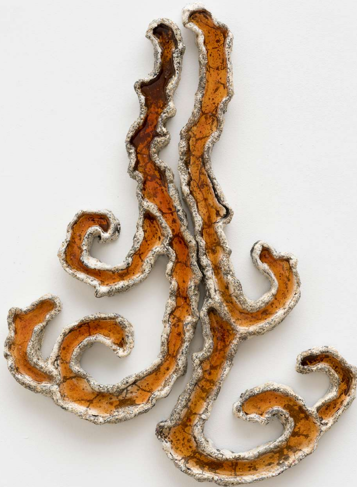
Fogo jovem [Young Fire], 2026 Areia, fragmentos de conchas, cimento, pó de mármore, resina, argila e porcelana fria [Sand, shell fragments, cement, marble dust, resin, clay, and cold porcelain] 59 x 44 x 3 cm [23 1/4 x 17 3/8 x 1 1/8 in] (YL-0023)