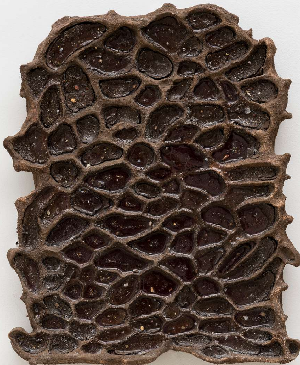
Castelinho [Little Castle], 2025 Assinada no verso [Signed on the reverse] Areia, fragmentos de conchas, cimento, pó de mármore, resina, argila e porcelana fria 52 x 41.5 x 5.5 cm [20 1/2 x 16 3/8 x 2 1/8 in] (YL-0022)