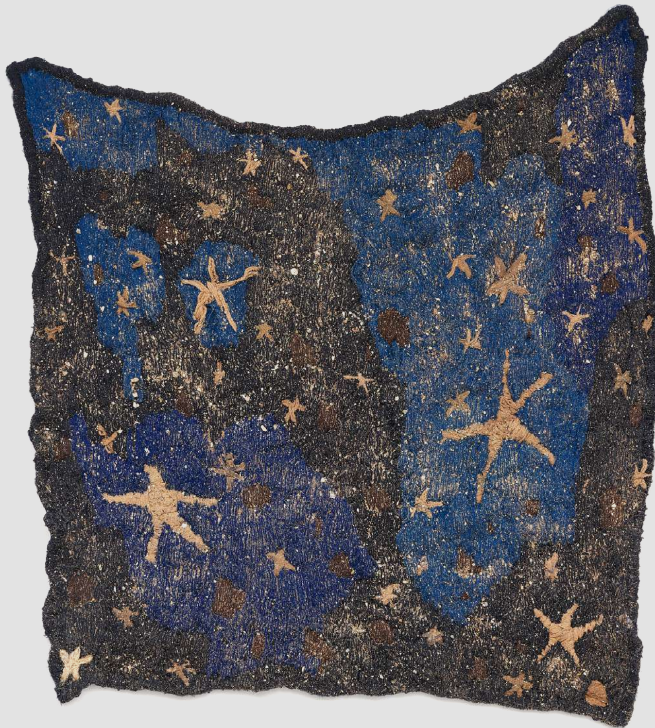
Um céu para Madalena [A Sky for Madalena], 2025 Areia rosa, fragmentos de conchas e uva sobre bordado de lã [Pink sand, shell fragments, and grape on wool embroidery] 123 x 108 x 5 cm [48 3/8 x 42 1/2 x 2 in] (YL-0006)