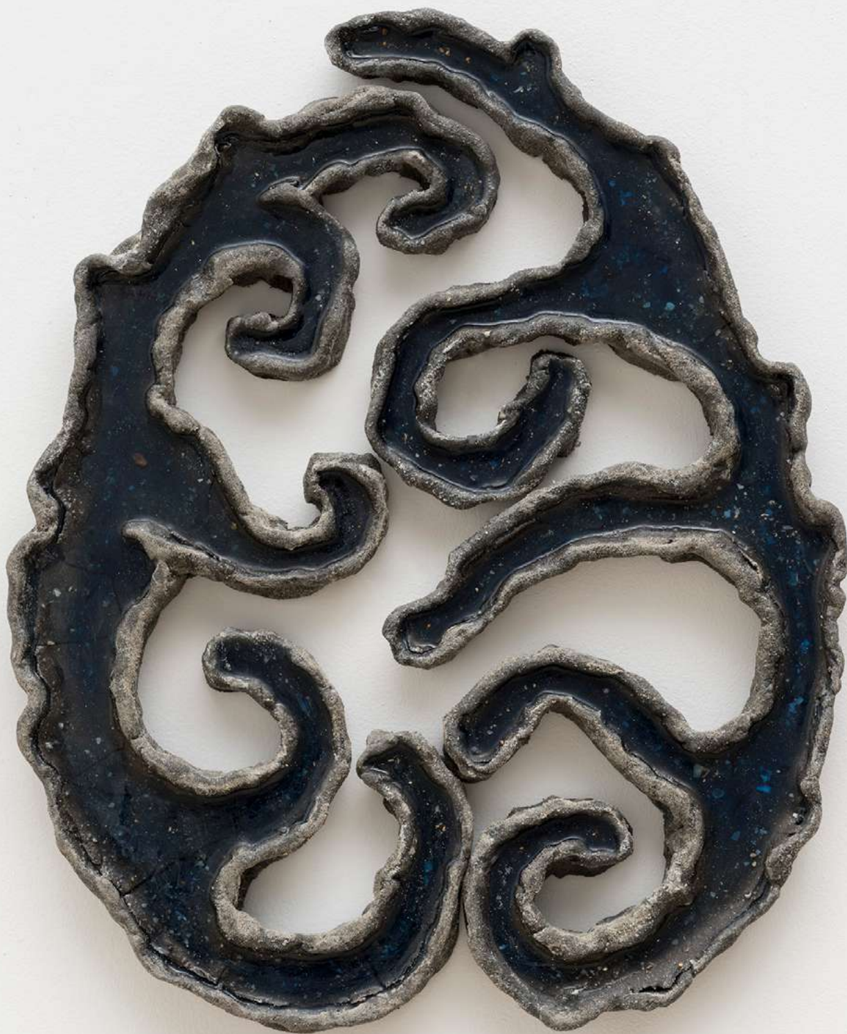
Beira-Mar [Seaside], 2026 Assinada no verso [Signed on the reverse] Areia, fragmentos de conchas, cimento, pó de mármore, resina, argila e porcelana fria [Sand, shell fragments, cement, marble dust, resin, clay, and cold porcelain] 49 x 39.5 x 3.5 cm [19 1/4 x 15 1/2 x 1 3/8 in] (YL-0024)