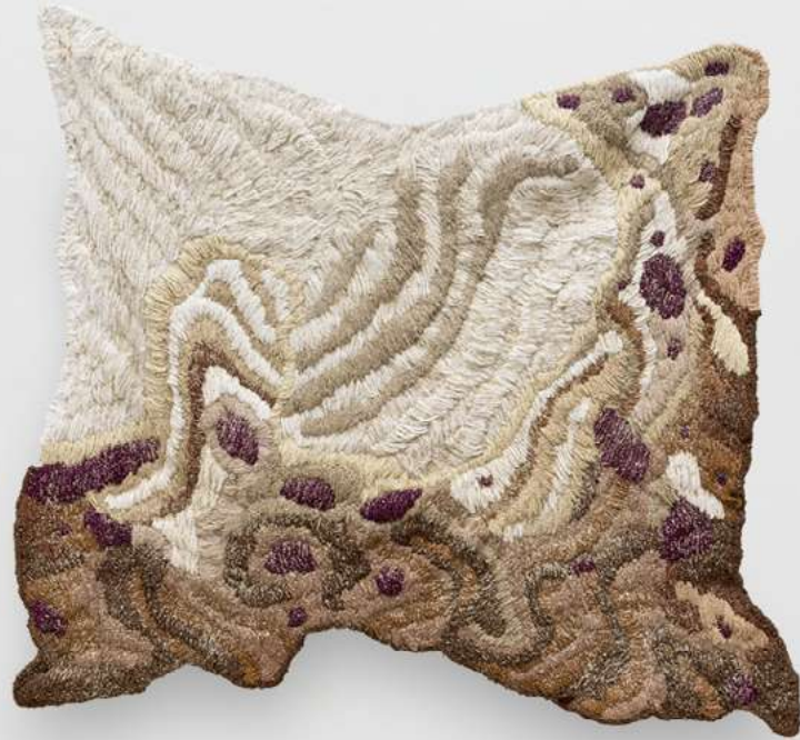
Berbigão [Cockle], 2026 Areia e fragmentos de conchas sobre bordado de lã [Sand and shell fragments on wool embroidery] 101 x 91 cm [39 3/4 x 35 7/8 in] (YL-0025)